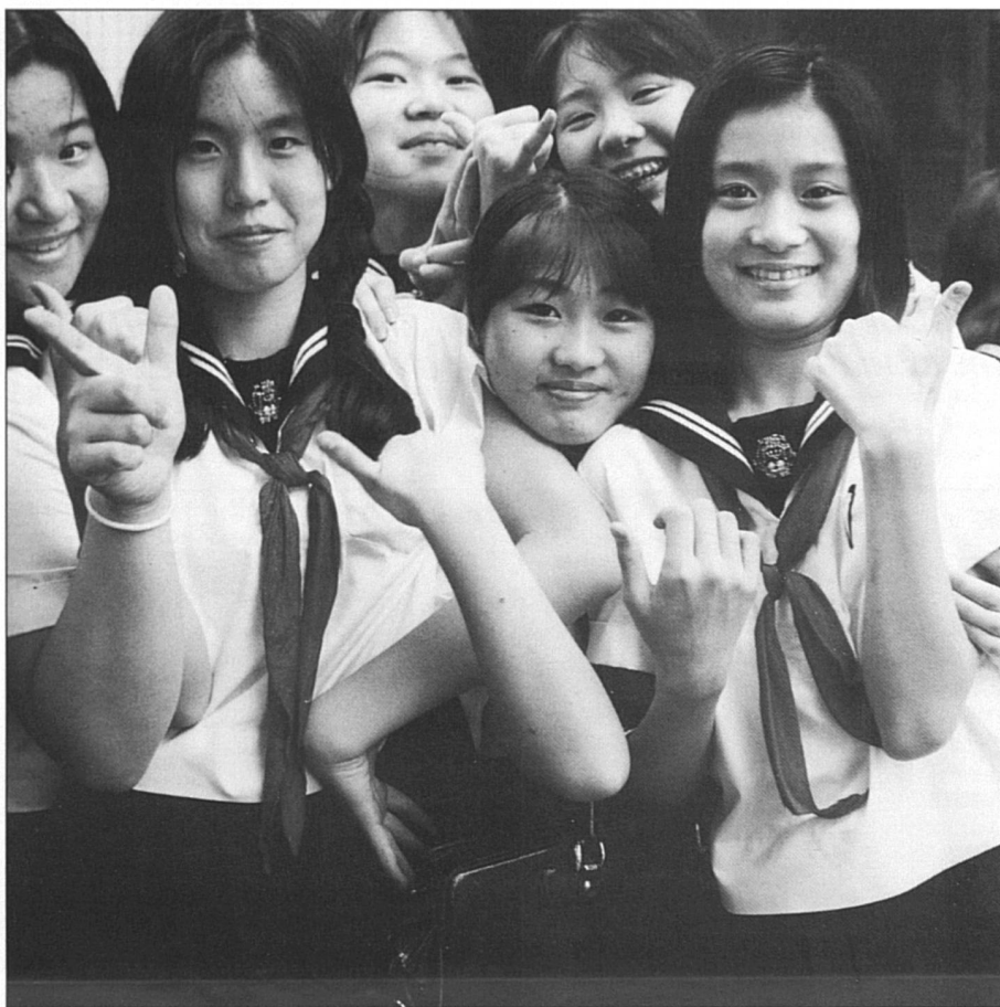
L'uniforme est encore de rigueur pour les collégiennes et les collégiens.

demande quatre ans d'études, les étudiantes ne forment plus que le tiers des effectifs. Il faut signaler que cette proportion est en augmentation constante. Du côté des enseignantes, elles forment le 60% au niveau primaire, 25% au niveau secondaire, près de 40% aux «collèges» de 2 ans et 10% des universités. Là aussi les chiffres progressent de manière positive pour les femmes.