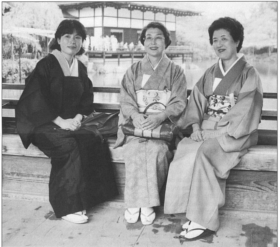
Des traditions encore vivantes. Ici, trois enseignantes du rituel de la cérémonie du thé à Kyoto.

Alors pourquoi ces mères au foyer qui disposent avec autorité du revenu familial et de l'avenir des enfants – le mari apporte à la maison l'enveloppe du salaire encore fermée et laisse son épouse décider de tout – pourquoi ont-elles poussé leurs filles dans la voie des études et du travail rému-