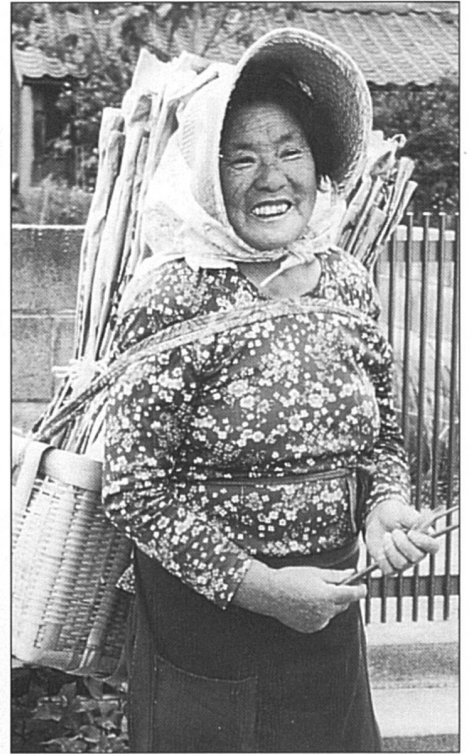
Femme de pêcheur dans l'île de Sado. Elle participe à l'emballage de la pêche et au séchage des calamars. Pour elle, pas de caisse de retraite.

Texte et photos: Odile Gordon-Lennox, correspondante de Femmes Suisses au Japon.