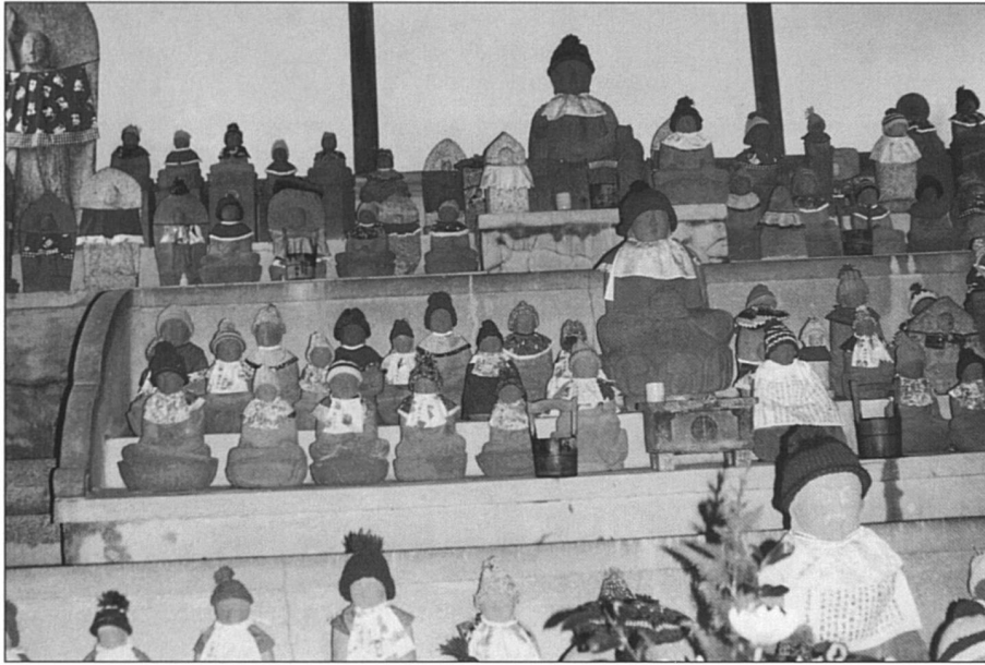
Jizo et ses statuettes votives pour apaiser l'esprit des enfants disparus.