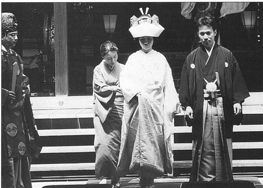
Mariage traditionnel dans un sanctuaire shinto. La pression familiale est intense pour encourager les jeunes femmes à se marier.

Avoir un enfant au Japon est une entreprise onéreuse. L'accouchement n'est pas remboursé par la caisse maladie nationale. Certains employeurs donnent cependant un bonus bébé. Le congé maternité est de 14 semaines, indemnisé à 60%, une fois le crédit des vacances épuisé! Depuis 1991, la loi prévoit la possibilité de demander un congé parental d'un an mais sans indemnité de salaire. En 1995, l'indemnité sera de 25% du salaire. Elle devra être augmentée au cours des années suivantes. La loi encourage aussi les employeurs à proposer des horaires de travail réduits pour les parents qui ne prendraient pas le congé parental ou qui ont un enfant d'âge préscolaire. Quelques rares entreprises profitent d'une nouvelle subvention étatique pour installer des crèches. Les journaux parlent sans cesse de la baisse de la natalité et du vieillissement de la population. Le taux de fertilité est de 1,5 enfant par femme, un des plus bas du monde. Le gouvernement avance lentement vers quelques modifications qui puissent encourager la natalité. Une enquête récente révèle qu'une majorité de parents souhaiteraient un autre enfant mais qu'ils renoncent faute d'argent surtout, à cause du travail de la mère et de l'exiguïté des logements ensuite.