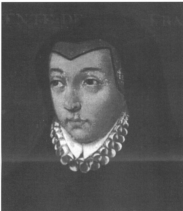
Aborder l'Histoire sans préjugés en y parlant des femmes qui l'ont influencée (ci-dessus Catherine de Médicis).

Enseignant l'histoire et l'allemand à des élèves et des apprentis d'une école supérieure de commerce genevoise, Rita n'hésite jamais à proposer un regard différent sur