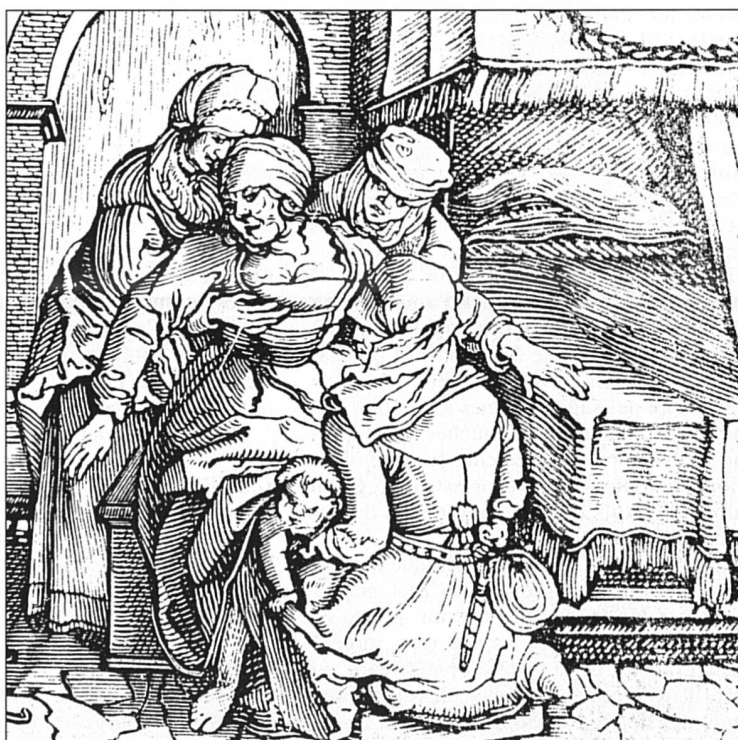
L'accouchement, durant longtemps domaine exclusif des femmes (gravure sur bois, 16 e siècle).

On meurt beaucoup en couches, à cette époque, et dans des souffrances effroyables. Pourtant, dans sa tentative de mettre au pas les accoucheuses, l'Eglise n'est pas mue par des préoccupations d'ordre sanitaire ou humanitaire. Elle a même tendance à considérer comme hérésiarques les pratiques visant à soulager les femmes de douleurs voulues par Dieu. Tu