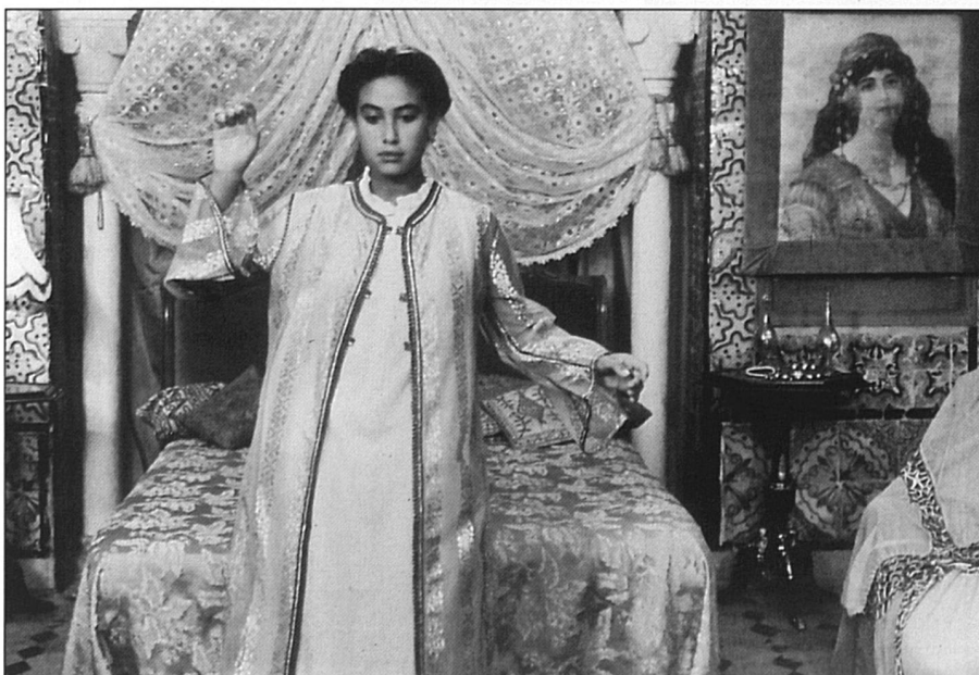
Alia exhume des souvenirs qu'elle pensait enterrés avec sa mère.

Regards tristes et révoltés de l'adolescente qui découvre les rouages de la vie, regards tout en subtilité, chaleureux, de la