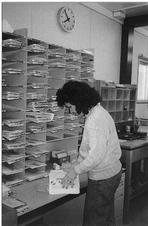
Un effort remarquable à la Direction générale des PTT, des Postes et des Telecom.

En Suisse alémanique, la restructuration a aussi touché l'entreprise d'électronique et de mécanique fine, Zellweger. Les mises à la retraite anticipée et les licenciements ont touché avant tout les femmes, moins qualifiées. Malgré le chômage, on tend à plus d'heures de travail, ce qui discrimine principalement les femmes. Le marché étant saturé, les chances de trouver un travail à temps partiel ou une possibilité de réinsertion sont moindres, les améliorations sociales sont gelées (congé maternité, crèches, réfectoires, etc). Selon le patron de l'entreprise: « L'esprit patriarcal tend à gagner du terrain, l'employé est censé être heureux d'avoir du travail. Les revendications féminines sont poliment écartées. Mais les femmes se montrent aussi plus réservées ou résignées ». Malgré ce constat pessimiste, il n'est pas question pour Zellweger de revenir en arrière sur la mise en place du principe de l'égalité. Le réflexe « femme » est entré dans les moeurs, les progrès à réaliser sont simplement partie remise.