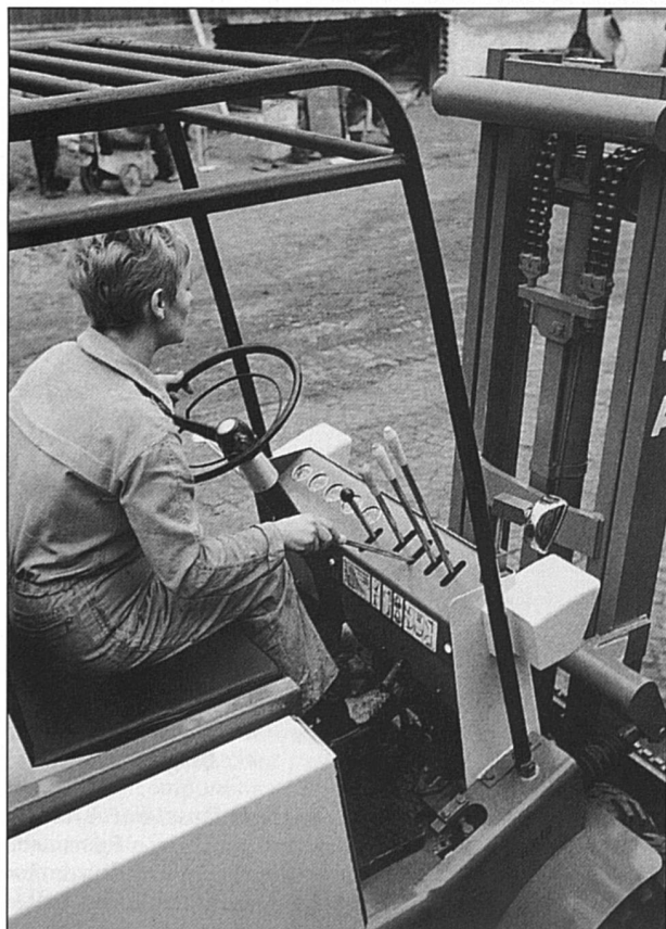
Imaginer la présence des femmes partout, même où on n'a pas l'habitude de les voir.

Convaincus, une dizaine de services ont d'ores et déjà annoncé leur souhait d'établir leur propre plan sectoriel.