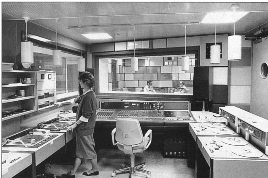
La RTSR n'est pas en reste.