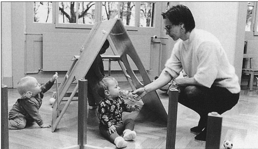
Pour la garde des enfants, des solutions diverses.