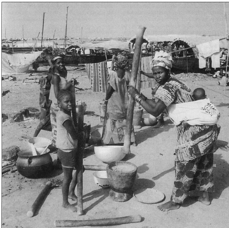
Les femmes sont les victimes privilégiées des mesures d'ajustement structurel.

Dans les pays industrialisés, les restructurations économiques se font à l'aveugle sans véritable réflexion sur leur impact.