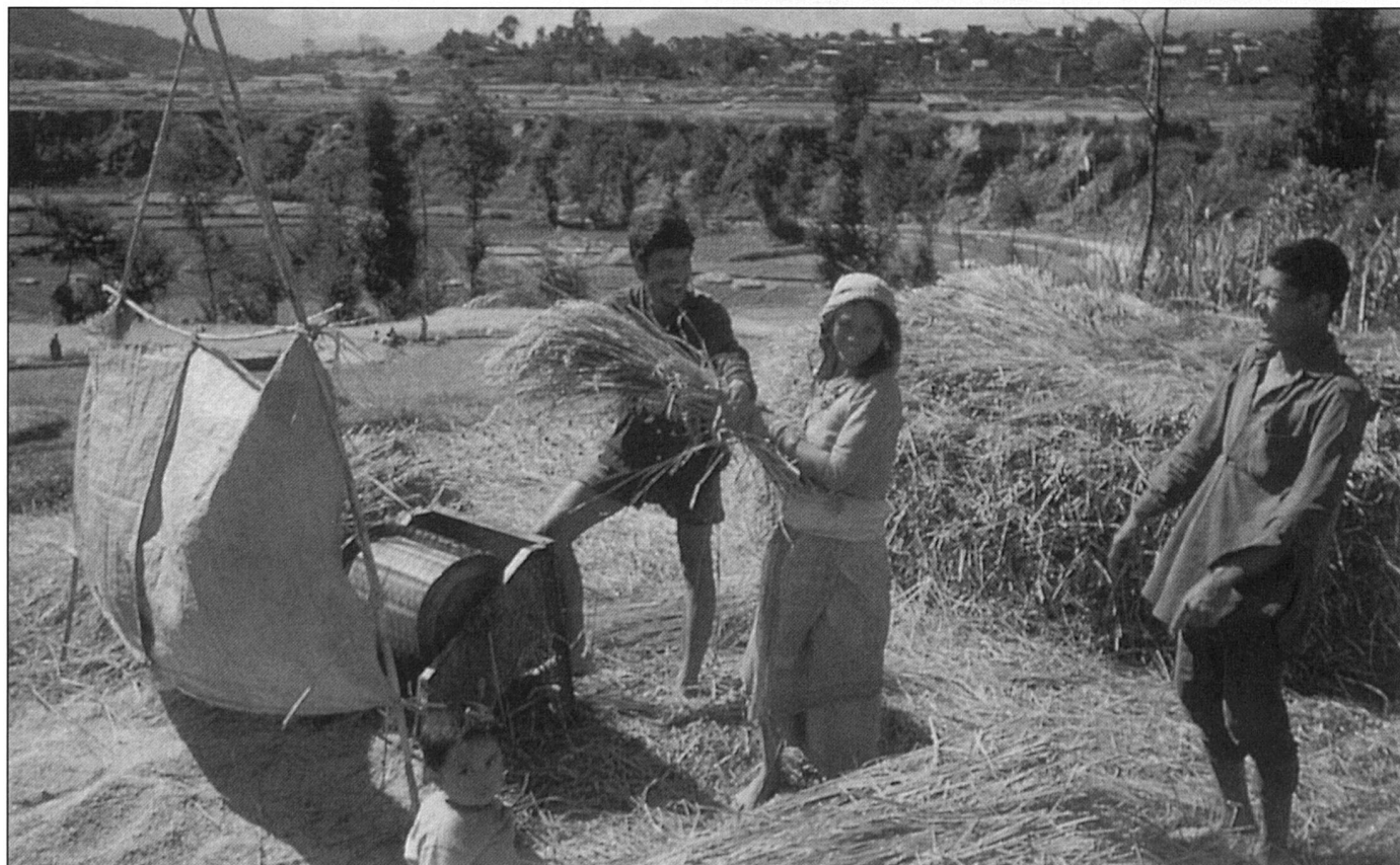
Café colombien ou riz asiatique piégés par les prix internationaux.