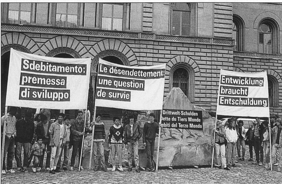
Le désendettement par des politiques d'ajustement, oui, mais comment «ajuster»?

Les politiques d'ajustement se heurtent aussi aux pratiques protectionnistes des pays du Nord, lesquels s'empressent d'ériger des barrières douanières dès qu'un produit du Sud menace leurs industries. On oblige donc les économies du Sud, les plus