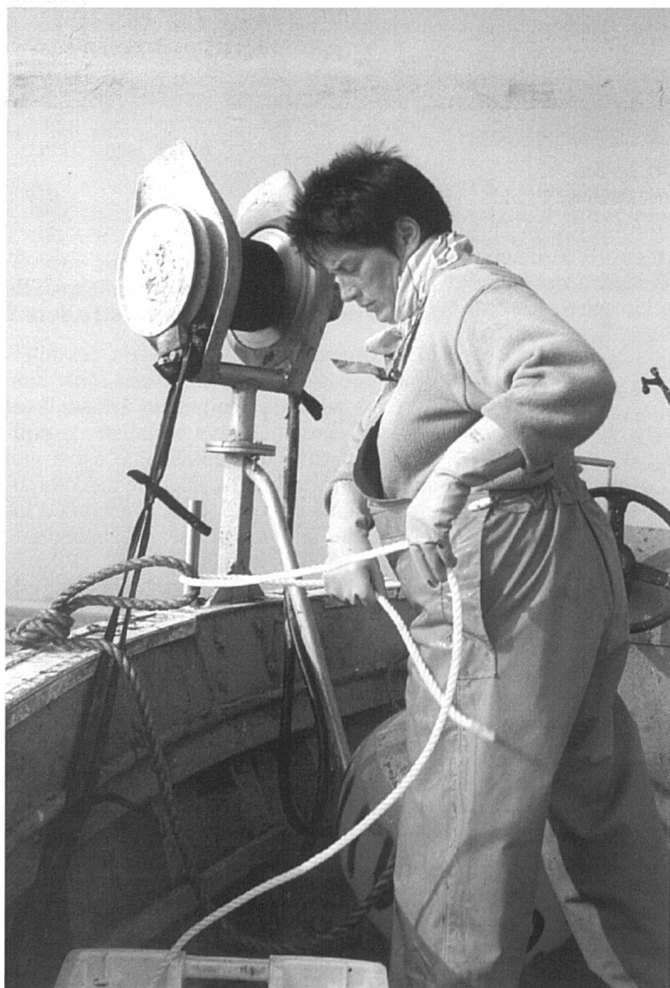
D'avril à octobre, du lundi au dimanche, de l'aube à la nuit, par beau temps ou temps maussade, il faut chercher le poisson...