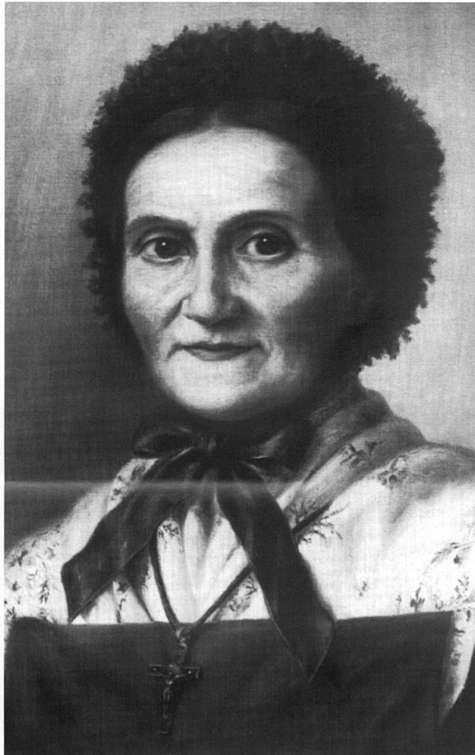
Marguerite (1815-1879) vénérée à la Fille-Dieu depuis plus de 100 ans, béatifiée le 29 octobre dernier à Rome.

Marguerite Bays (1815-1879), qu'on appelait «Goton», est une fille du pays.