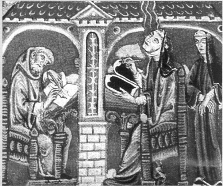
Hildegarde de Bingen recevant la lumière divine

Les CD Ordo Virtutum et récemment Les chants de l'extase* ont rendu Hildegarde de Bingen célèbre dans les pays francophones. Elle l'était déjà en Allemagne et en Suisse allemande. En outre, la médiéviste Régine Pernoud vient d'en donner une biographie**, qu'elle sous-titre Une conscience inspirée du XII e siècle .