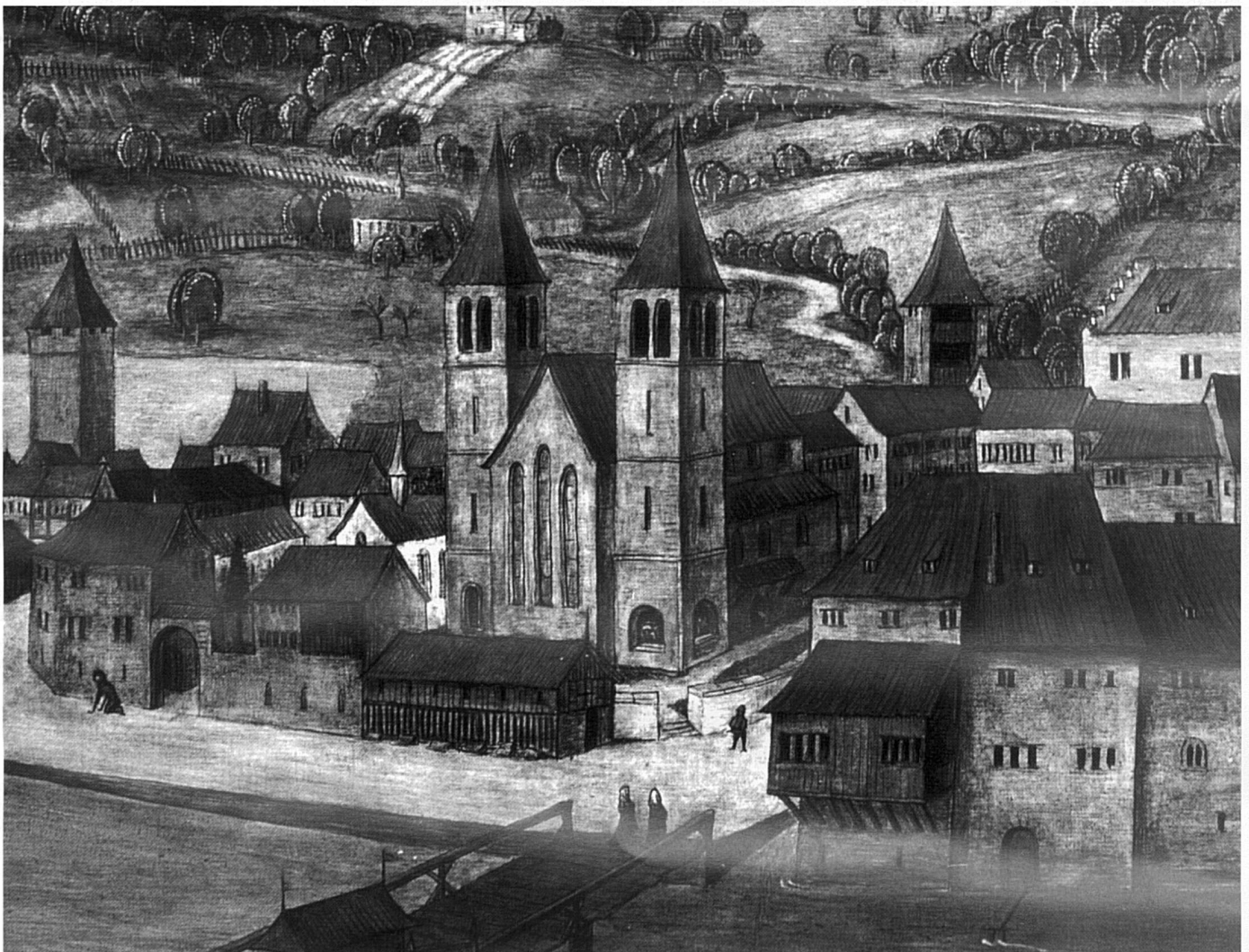
Le Fraumünster de Zurich est à l'origine du développement économique, politique et culturel de la ville.

Zürich und sein Fraumünster , Peter Vogelsanger. - Ed. Neue Zürcher Zeitung, 500 pp.