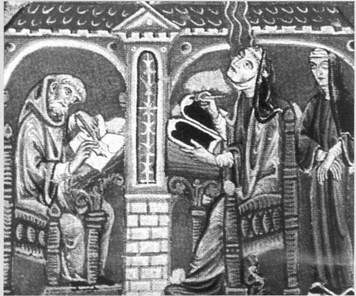
Hildegarde de Bingen recevant la lumière divine

Les CD Ordo Virtutum et récemment Les chants de l'extase* ont rendu Hildegarde de Bingen célèbre dans les pays francophones. Elle l'était déjà en Allemagne et en Suisse allemande. En outre, la médiéviste Régine Pernoud vient d'en donner une biographie**, qu'elle sous-titre Une conscience inspirée du XII e siècle .