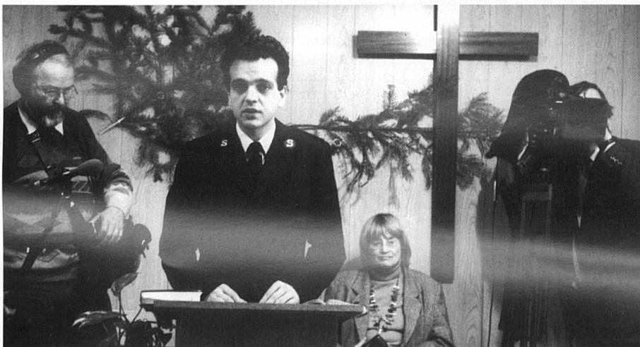
Séance de tournage à Rouen.