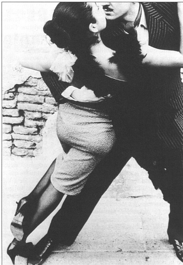
Les victimes de violence sexuelles ou conjugales sont assimilées à des cas sociaux nécessitant une aide.

Les travaux théoriques sont nécessaires pour mieux comprendre le phénomène et élaborer des stratégies pour combattre le mal à la racine. Néanmoins, aucune amélioration ne viendra si le grand public ne saisit pas la nécessité de lutter contre les mauvais traitements dont sont victimes les femmes. Afin de tailler dans l'étoffe parfois coriace des mentalités, plusieurs de nos interlocutrices insistent sur l'importance de dénoncer formellement la violence contre les femmes comme un crime sexiste. Il s'agit tout simplement de lui donner un nom et de ne pas la laisser s'échapper dans des catégories fourre-tout telles que «voies de fait» ou «lésions corporelles». Aux yeux d'Anne-Marie Barone, une disposition qui définit la violence conjugale sous ses différentes