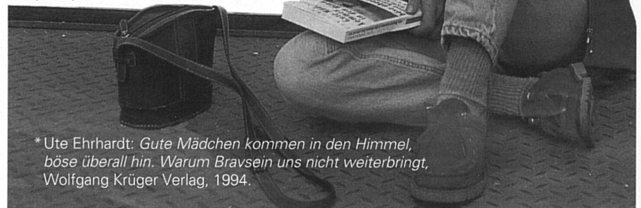
* Ute Ehrhardt: Gute Mädchen kommen in den Himmel, böse überall hin. Warum Bravsein uns nicht weiterbringt , Wolfgang Krüger Verlag, 1994.

Oui, sûrement. Mais je dois dire qu'après un certain temps, j'ai arrêté de collaborer au journal. Il y avait plusieurs raisons à cette décision. C'était devenu difficile à assumer. Je souffrais des débats que je provoquais. Remettre sans cesse en question les relations hommes-femmes touche finalement à la sphère personnelle. Avec le féminisme revenait aussi à la surface la séparation de mes parents. Le féminisme de ma mère en était peut-être une des causes. C'est du moins ce que prétendait mon frère. Féminisme rimait de plus en plus avec rupture et sépa-