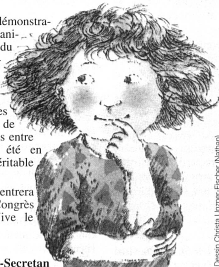
Dessin: Christa Unzner-Fischer (Nathan)