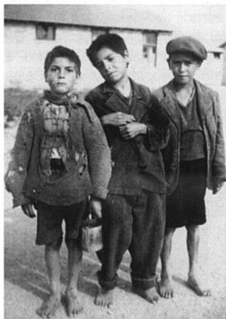
Trois Gitans du camp

Il y a dans notre passé du temps de guerre des pages sombres qu'on n'a pas le droit d'oublier, mais il y en a de claires aussi qu'il ne faut pas oublier non plus... Il y a de part et d'autre des témoignages qu'il faut recueillir pendant qu'il en est encore temps. Ainsi l'action du Secours Suisse aux Enfants. On se souvient peut-être encore de ces trains d'enfants qui venaient de France reprendre des forces, de ces récoltes de fonds, de vivres, d'habits, de jouets destinés aux homes, maternités ou camps de réfugiés où le SSE envoyait des infirmières.