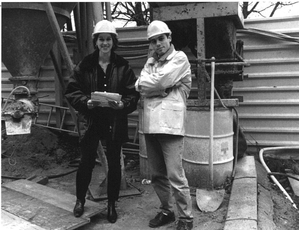
«Ingénieurs, ingénieures»

Au fil des années, l'expérience confirme que c'est bien à travers nos outils habituels de psychologue (notamment la capacité de reconnaissance de l'autre dans ses envies, ses rêves, ses peurs, ses doutes... «rôle de contenant», ainsi que la capacité à reformuler un vécu... «effet miroir») que nous pouvons le mieux répondre aux demandes. Celles-ci, au-delà des conseils et informations pratiques, se situent, aussi bien chez les jeunes que