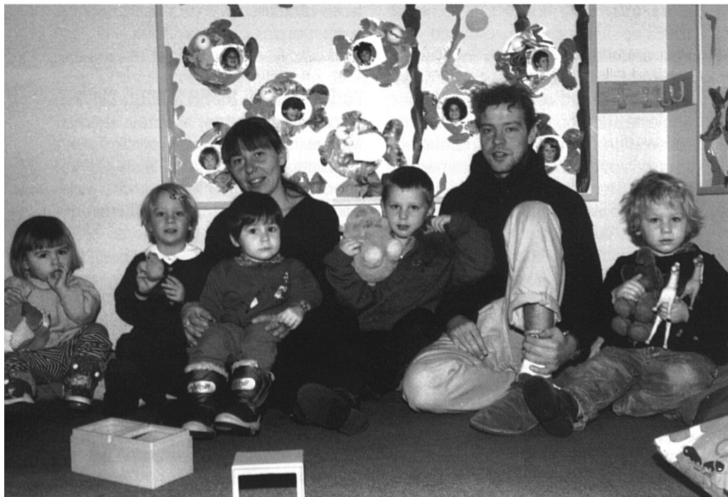
«Educateur, éducatrice de la petite enfance»

Le Québec est à nouveau pionnier dans sa manière d'aborder la problématique, grâce aux deux ouvrages: Garçons et filles, stéréotypes et réussite scolaire 1 , ainsi que Modèles de sexes et rapports à l'école 2 . Les équipes rédactionnelles ont cherché à comprendre et à démonter les mécanismes de cette contradiction, en prenant pour hypothèse de départ le contre-pied de Baudelot et Establet 3 .