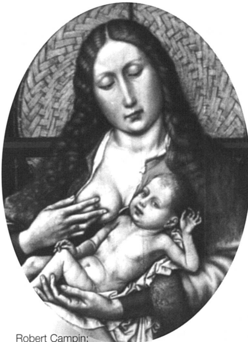
Robert Campin: Madone allaitant, détail

En outre, l'IPG ne distingue pas entre la recherche médicale, qui se fait en laboratoire et dans les universités, et sans but lucratif, et la recherche dans l'agroalimentaire. Et là encore, faudrait-il distinguer entre une recherche comme celle qui a abouti à la «révolution verte» et a sauvé des populations de la famine, et celle poursuivie dans le seul but d'un profit à court terme. Peut-être, là, tient-on moins compte d'éventuels effets pervers à long terme? Mais les lois d'application peuvent et doivent mettre les limites nécessaires.