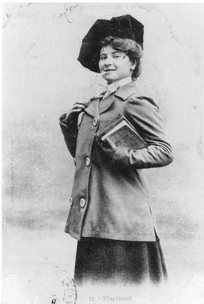
Carte postale vers 1900, Coll. Joëlle de Syon, exposée à Conches.

Et n'oubliez pas En attendant le prince charmant . L'éducation des jeunes filles à Genève, 1740-1970. Une exposition de la CRIEE à voir au Musée d'ethnographie, annexe de Conches, à Genève jusqu'au 18 avril 1998.