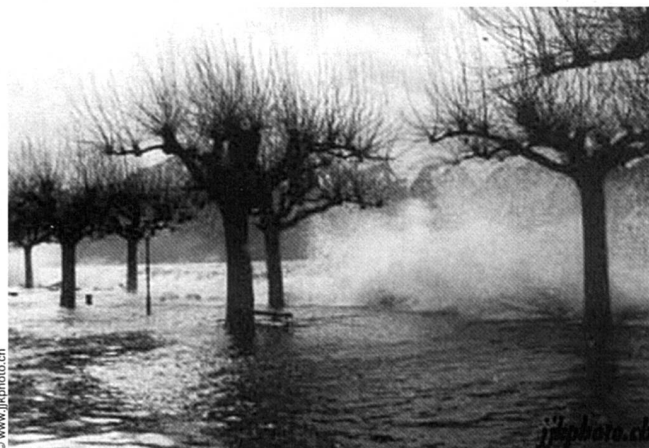
Déforestation, désertification et sécheresse rendent l'eau pure de moins en moins accessible. Dans les pays du Sud, plus de 30 % des décès sont imputables à la crise de l'eau.

Dans les catastrophes de Love Canal (États-Unis) et de Bhopal (Inde), les enfants furent les victimes les plus gravement touchées. Dans les deux cas, ce sont les femmes qui ont continué à résister et qui ont refusé de se taire comme l'auraient souhaité les représentants des entreprises et de l'État. Love Canal était un site où durant des décennies, la Hooker Chemical Company avait déversé ses déchets chimiques, et sur lequel, plus tard, on construisit des logements. Dans les années '70, c'était un quartier résidentiel paisible, habité par des gens de la classe moyenne, ignorant l'existence de déversements toxiques dans le sous-sol de