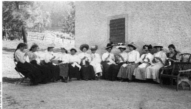
Travaux d'aiguille. Mayens-de-Sion, vers 1910.