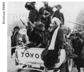
Les Talibans rejettent la musique, la photographie, la télévision, le cinéma sous prétexte que ces pratiques «modernes» sont sataniques. En revanche, ils n'ont pas de scrupules à circuler dans le dernier modèle de Toyota.

L'Association révolutionnaire des femmes d'Afghanistan a été fondée en 1977 sous la monarchie pour revendiquer l'égalité entre femmes et hommes par Meena, étudiante en droit. L'invasion soviétique, la mise en place d'un gouvernement communiste fantoche, la guerre entre mouvements soutenus par divers pays étrangers (dont les Etats-Unis) ont conduit le RAWA à s'engager prioritairement pour la démocratie et le respect des droits humains. Meena a du reste payé de sa vie cet engagement. Elle a été assassinée à Quetta au Pakistan en 1987 par des agents à la solde du KGB. Pour en savoir plus : www.rawa.org .