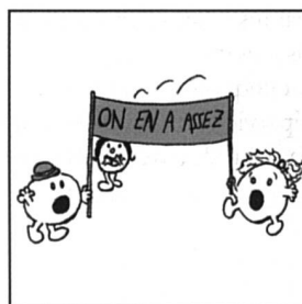
Un soir Madame Féministe invita toutes ses amies et...