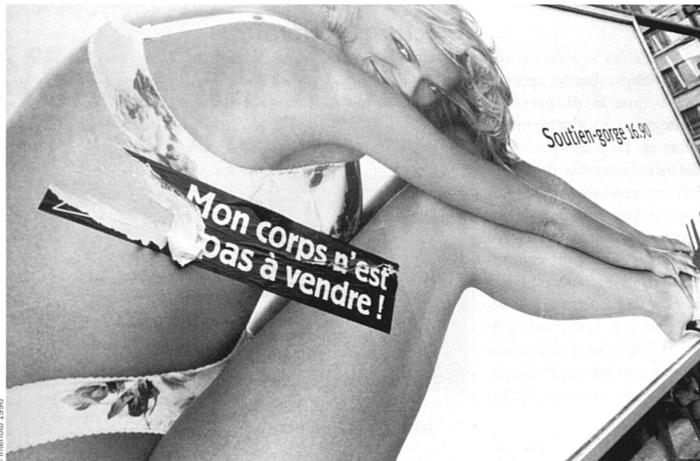
Certaines femmes font de la résistance.

Il y a quelque temps, un chœur d'hommes qui a toujours fermement refusé la mixité préparait un concert. Une villageoise pianiste l'accompagnait bénévolement pendant les répétitions et le concert. Pour fêter le succès qu'il remporta, le chœur décida de s'offrir une «virée» et invita... le mari de la pianiste. Celui-ci a accepté, sans états d'âme, rassurez-vous!