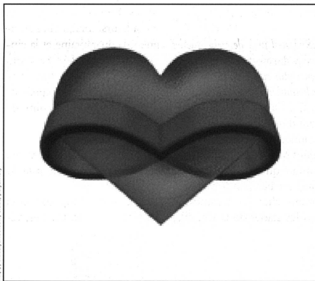
Le signe de l'infini superposé au cœur représente le symbole de la non-monogamie responsable, fondée sur l'amour et l'honnêteté.

Les «vrai-e-s» non-monogames, elles et eux, existent toujours, et c'est sur Internet qu'on a le plus de chances de les trouver. En parcourant leurs sites, on découvre des personnes qui s'investissent dans plusieurs relations d'amour (d'où l'expression polyamour, synonyme de non-monogamie) dans un contexte d'ouverture et d'honnêteté. La communication et la négociation sont particulièrement importantes dans ce type de relations, puisque les partenaires sont toutes et tous au courant de l'existence des autres. Les relations «poly» peuvent prendre toutes les formes possibles et imaginables, pour autant que cela convienne aux partenaires impliqué-e-s. Les structures les plus fréquentes restent cependant le V (une personne au centre qui a deux relations) et le triangle. Il est à noter d'ailleurs que la fidélité n'est pas incompatible avec la non-monogamie, comme par exemple dans le cas d'un triangle fermé (on parle alors de polyfidélité). Bref, loin d'une image d'immoralité, on découvre des gens qui ont un projet relationnel et de société, et qui le mènent dans le respect des valeurs qui, si elles ne sont pas les plus communes, sont celles qu'elles et ils ont choisies.