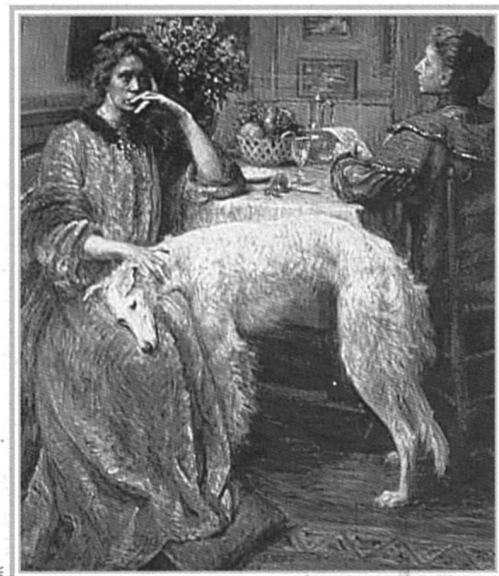
Louise Breslau, La vie pensive, 1908.

FenS: Comment expliquez-vous que ce thème de l'amour lesbien ait été traité si souvent?