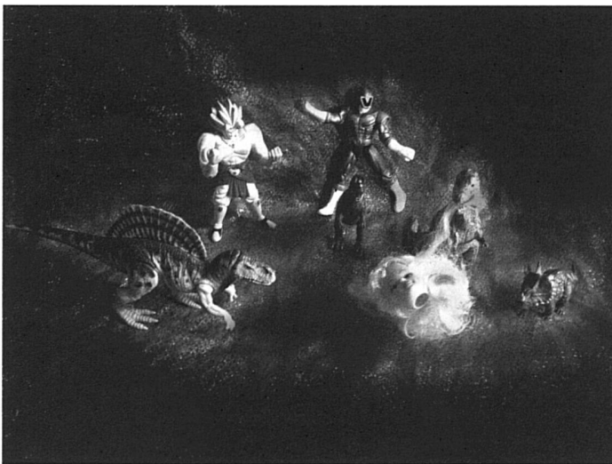
Les super héros intergalactiques sont appelés en renfort. Arriveront-ils à temps pour sauver Pam?