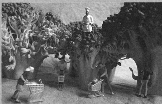
« pâtes aux brocolis et à la spiruline » de Sylvain Fournier