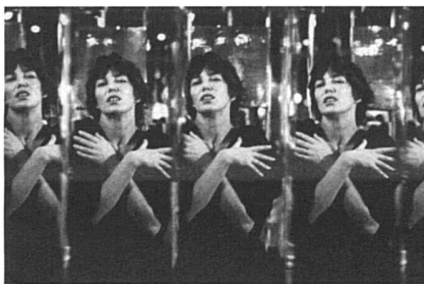
Jane B. par Agnès V.

Ce jeu sur les frontières entre réalité et fiction est accentué par le fait qu'Agnès Varda participe toujours du récit, et ce dès son premier film, dès ses tout premiers plans. Dans La pointe courte , la caméra dialogue avec les pêcheurs, s'infiltré dans leur domicile et dans leurs relations, suit au plus près leurs conversations et leurs interactions; elle a le poids d'une présence. Même dans ses documentaires, l'information est modelée par le regard de photographe de la réalisatrice, la place accordée à son imagination, ses partis-pris et ses réactions sur le vif, par ses apparitions à l'écran ou dans la bande-son; il en résulte l'impression d'une caméra personnifiée.