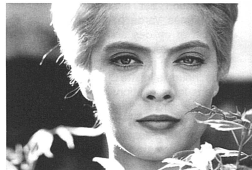
Corinne Marchand dans Cléo de 5 à 7

Dans Cléo de 5 à 7 , Varda ques-tionne la manière de représenter la femme à l'écran, remettant en cause la femme-objet de fantasmes et de pro-jections. Cléo, enfermée dans la toile du désir masculin, apprend à s'en dé-tacher. Dans Sans toit ni loi (1985), peut-être le film le plus âpre de la cinéaste, Mona est montrée uniquement à tra-vers la subjectivité des perceptions et des attentes des autres à son égard – attentes qu'elle refuse systématique-ment. Le spectateur ne peut dès lors jamais vraiment s'en rapprocher.