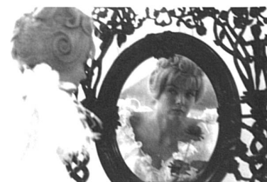
Corinne Marchand dans Cléo de 5 à 7