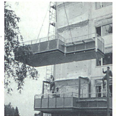
Mehr Wohnraum durch die vorge-setzten Balkone