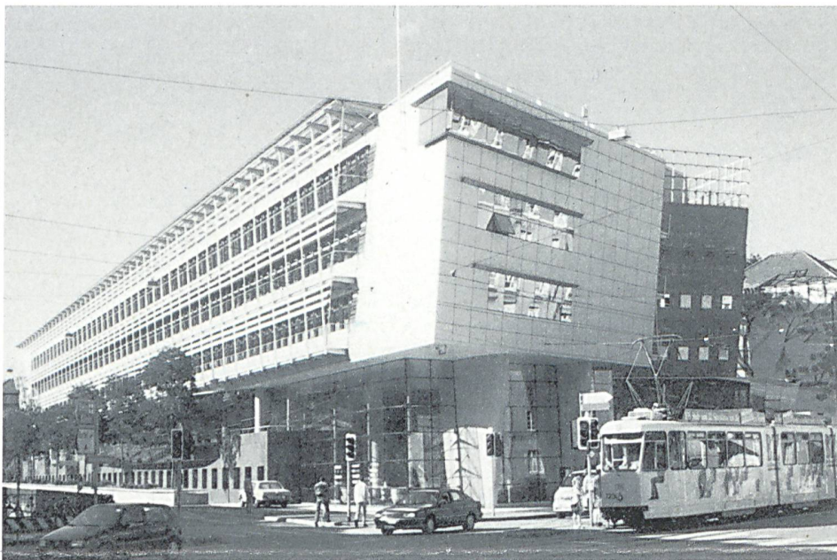
Das Bundesamt für Energiewirtschaft belegt die beiden obersten Stockwerke des Verwaltungs-Neubaus Titanic II.

Obwohl das BEW mit seinen rund 90 Mitarbeiterinnen und Mitarbeitern ein Bundesamt mit durchaus überblickbarer Grösse ist, war die Belegschaft jahrzehntelang an drei verschiedenen Standorten tätig. Das behinderte die interne Kommunikation: Sitzungen waren mit unfreiwilligen Fussmärschen verbunden, und der Post-Kurier liess manchmal auf sich warten.