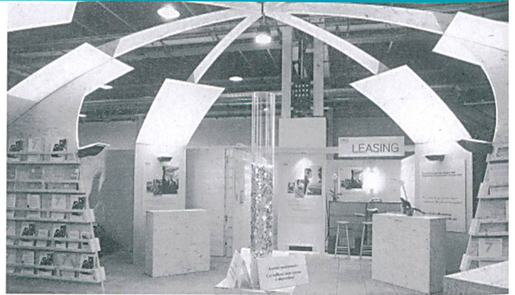
Informationen zum Geldsparen – angenehm vermittelt.

Anmeldungen und Informationen siehe Veranstaltungskalender auf Seite 8.