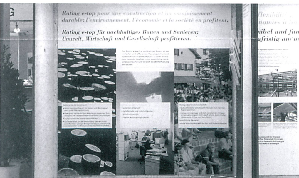
Alle profitieren vom nachhaltigen Sanieren mit dem rating e-top am Stand des Bundesamtes für Energie

Besuchen Sie auch die Sonderschau «Umwelt- und zeitgerechtes Heizen mit Wärmepumpen» Halle 5, Stand Nummer 569