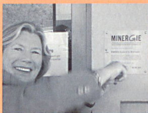
Mit viel Energie montiert Regierungsrätin D. Schaer-Born, Bern, das MINERGIE-Label am ersten nach MINERGIE sanierten Hochhaus.

Weshalb setzen die Kantone auf MINERGIE? Bis heute hatten die Anstrengungen zur Lösung der Energie- und Klimaprobleme oft den Beigeschmack eines Opfers – eines Opfers, das von staatlicher Seite verlangt wird und mit unverhältnismässigen Kosten oder spürbaren Einschränkungen der Lebensqualität verbunden ist.