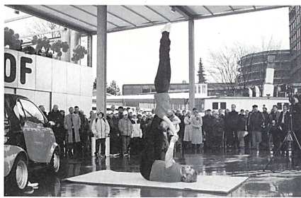
Die persönliche Mobilität – auch das ein Thema

Um sich für die Freiheit des individuellen Mobilitätsmanagements begeistern zu können, um die grundlegende Bedeutung des Verkehrs für die Energie- und Klimapolitik zu verdeutlichen – hier Facts und Figures von der Mobilitäts-Veranstaltung von EnergieSchweiz am 4. März 2001.