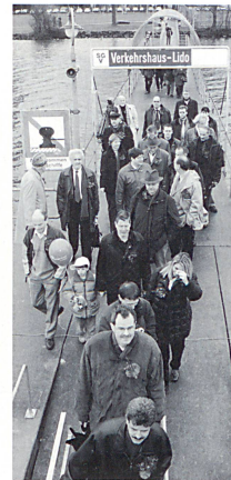
Zu Fuss, per Schiff, Bahn, Bus, Velo und Auto ... Gäste von EnergieSchweiz am Erproben verschiedener Mobilitätsformen

Sie haben nachhaltige Mobilität bereits in der Schule gelernt: Schöleninnen der Scuola elementare Mobio Inferiore