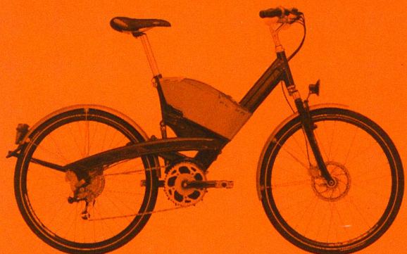
Das ist der 1. Preis: Elektrobike Flyer F6

BFE, Sektion Information, «energie extra», 3003 Bern; Tel. 031 322 56 64, Fax 031 323 25 10