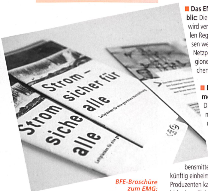
BFE-Broschüre zum EMG: Alles Wesentliche auf 20 Seiten

■ Das EMG stärkt die schweizerische Elektrizitätswirtschaft und deren Personal: Die Marktöffnung führt zu mehr Wettbewerb in der Stromwirtschaft und erhöht deren Effizienz. Das EMG gewährleistet den einzelnen Unternehmen eine schrittweise Anpassung an das neue Umfeld. Das Gesetz äussert sich aber nicht zur Organisationsform der Unternehmen. Ob diese weiterhin im Besitz der öffentlichen Hand bleiben oder privatisiert werden, entscheiden wie bisher die Stimmbürgerinnen und Stimmbürger der betroffenen Kantone und Gemeinden. Die Elektrizitätswirtschaft kann als gleichberechtigter Partner am europäischen Strommarkt teilnehmen. Um das Personal vor allfälligen negativen Folgen der bereits laufenden Marktöffnung zu schützen, wird die Elektrizitätswirtschaft zu Ausbildungs- und Umschulungsmassnahmen verpflichtet. Diese Schutzmassnahme ist einmalig in der schweizerischen Wirtschaftspolitik.