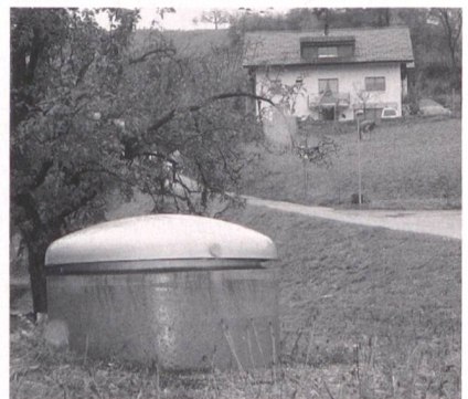
Die Energiestadt Münsingen (BE) hat bei der Wasserversorgung mit einem Massnahmenpaket bereits Kosten eingespart.

Beispiel Münsingen. Die Untersuchung der drei Fallbeispiele ist als Broschüre erschienen und war Ende Juni Gegenstand einer Tagung in Bern. Die ca. 60 Tagungsteilnehmer hatten anschliessend die Gelegenheit, die Wasserversorgung der Energiestadt Münsingen zu besichtigen. Dort wurden in den letzten Jahren zwei Drittel der Wasserverluste aufgehoben, Pumpen mit hohem Wirkungsgrad eingesetzt und eine Trinkwasserkraftanlage eingebaut.