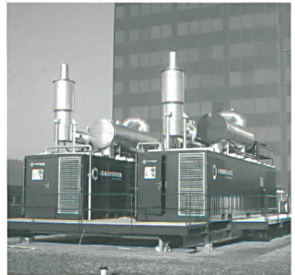
Einkaufszentrum Glatt: Neue Lüftungsanlage

Ziele. Bis 2010 dürften die Einkaufszentren gegenüber dem statistischen Ausgangsjahr 1990 eine CO 2 -Reduktion von rund 30 Prozent erreichen. Punkto Energieeffizienz (Ziel: 10 Prozent Verbesserung in 10 Jahren) sind die Einkaufszentren auf Kurs: Sie konnte seit 2000 um zirka 2 Prozent verbessert werden. Zu den CO 2 -Emissionen fehlen noch konkrete Zahlen.