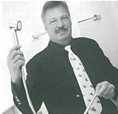
Diese Brause spart Wärme und Wasser.