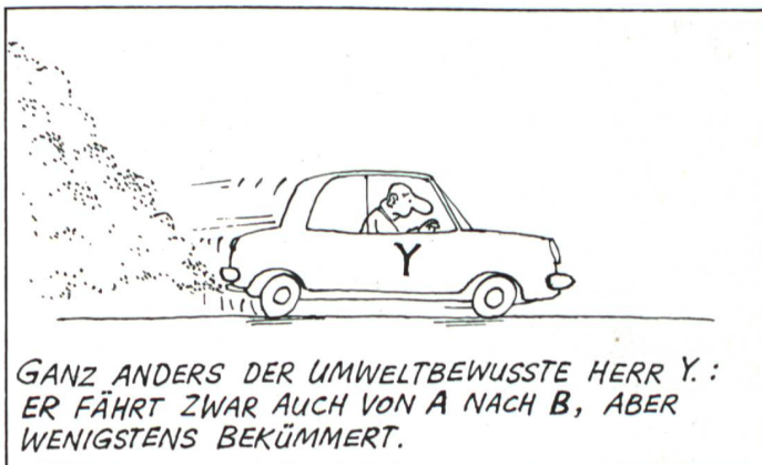
GANZ ANDERS DER UMWELTBEWUSSTE HERR Y.: ER FÄHRT ZWAR AUCH VON A NACH B, ABER WENIGSTENS BEKÜMMERT.

Der Gasverbund Mittelland bestellte beim Einsiedler Carosserieunternehmen Koch eine Vorserie von 50 Fahrzeugen, von denen etwa 35 derzeit Testkilometer abspulen. Ab 2004 soll das saubere Gefährt im Smart Center Bern erhältlich sein, eventuell auch in weiteren. Der Preis liegt mit 20 000 Franken rund 4000 Franken über jenem für den Smart Pulse. Aktuell gibt es im Mittelland etwa 25 Erdgastankstellen, bald sollen es mehr sein.