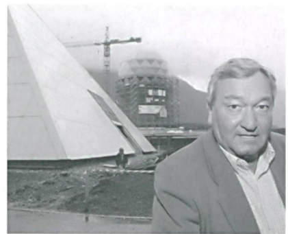
Erich von Däniken, Mystery Park