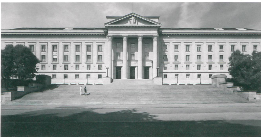
Fällte bedeutsamen Entscheid: Bundesgericht in Lausanne

Die FEW stellten beim Bundesrat ein Gesuch in diesem Sinne. Ihnen wurde allerdings nicht zugestanden, dass das Urteil des Bundesgerichts während der Dauer dieses Verfahrens nicht vollstreckt würde. Danach zogen die FEW ihr Gesuch zurück, da sich ELSA und Micarna nach neuen Verhandlungen mit Watt und FEW schliesslich für eine Stromversorgung durch die FEW entschieden.