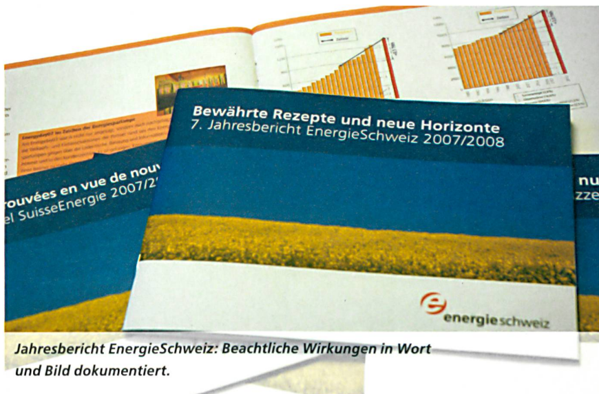
Jahresbericht EnergieSchweiz: Beachtliche Wirkungen in Wort und Bild dokumentiert.