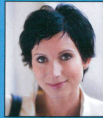
P. Bruderer Wyss Nationalratspräsidentin und Unternehmerin