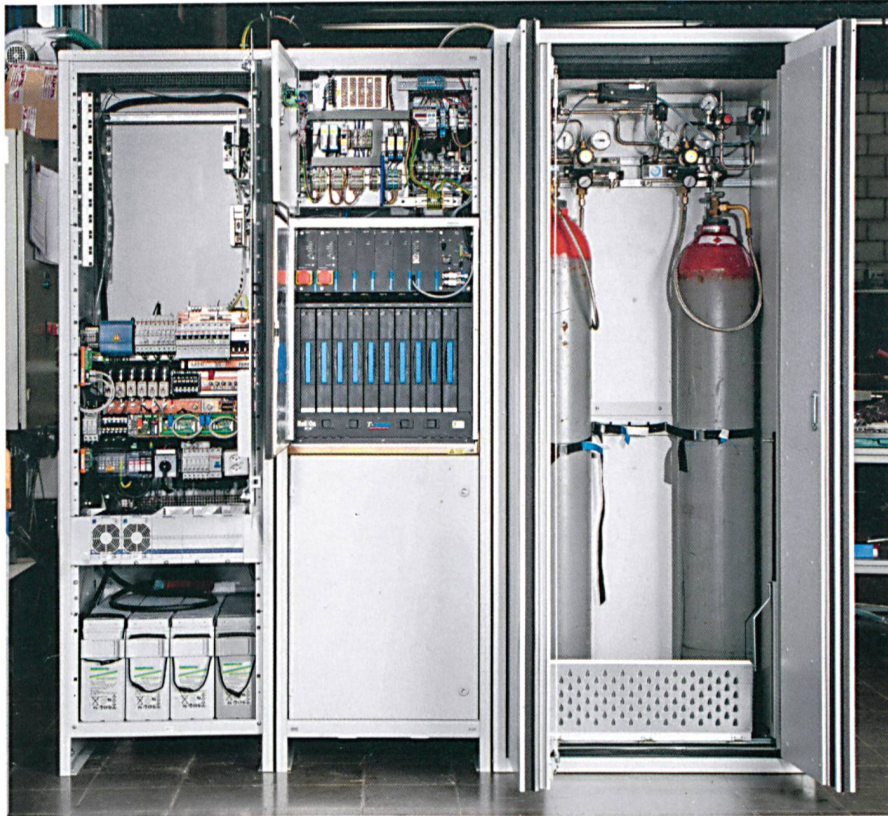
Integration eines kommerziellen Brennstoffzellensystems in ein System zur unterbrechungsfreien Stromversorgung.

zehn Partner, drei davon sind schweizerische Einrichtungen: die Hochschule Luzern, die Swisscom und die Betriebskommission Polycom des Kantons Nidwalden.