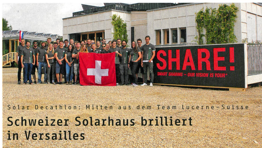
Solar Decathlon: Mitten aus dem Team Lucerne-Suisse

Auf Mitte Jahr haben zwei Energie-Kompetenzzentren im Aktionsfeld «Effizienz» ihre Arbeit aufgenommen. Somit sind alle sieben im Aktionsplan «Koordinierte Energieforschung Schweiz» definierten Aktionsfelder, mit welchen der Bundesrat und das Parlament die Energieforschung in den kommenden Jahren stärken will, mit geeigneten «Swiss Competence Centers for Energy Research» (SCCER) besetzt. Für den Aufbau der nötigen Forschungskapazitäten und den Betrieb im Aktionsfeld «Effizienz» stehen für die Jahre 2014 bis 2016 zehn Millionen Franken zur Verfügung. Das «Leading House» des SCCER «Future Energy Efficient Buildings and Districts» ist die Eidgenössische Materialprüfungs- und Forschungsanstalt (Empa), beim SCCER «Efficiency of Industrial Processes» ist es die ETH Zürich.