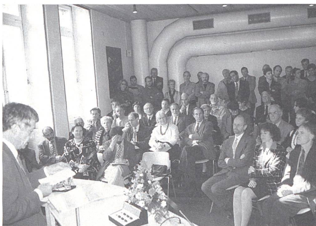
Ouverture de l'exposition L'AIR en présence du Conseiller fédéral Moritz Leuenberger.

L'exposition se prolonge par un jeu informatique permettant à chacun de mesurer son bilan en termes d'émissions de CO2 et ses marges de manœuvre. Le CD avec le texte de l'audioguidage récité par des comédiens