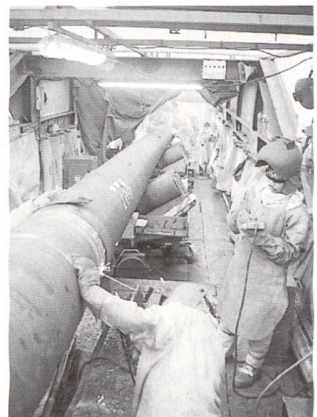
Construction de gazoduc.

La concession est assortie d'une charge; durant les 50 ans de sa validité, la SA Transitgas doit faire en sorte de disposer des capacités nécessaires pour couvrir les besoins en gaz actuels et prévisibles de la Suisse. Cet engagement est une contrepartie au fait