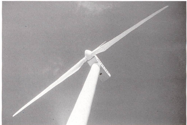
Au Mont-Crosin, les éoliennes ont fait leur preuve.

Avec une puissance totale de 2.145 MW, les résultats sont légèrement inférieurs aux prévisions. Les terrains complexes, la turbulence des vents et le givre sont autant de problèmes spécifiques plus contraignants que les conditions des installations situées sur les côtes européennes.