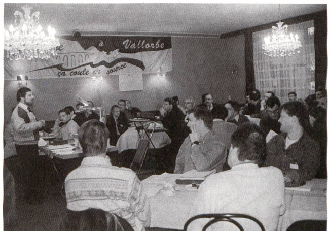
Séminaire sur le bois: notre pétrole indigène.