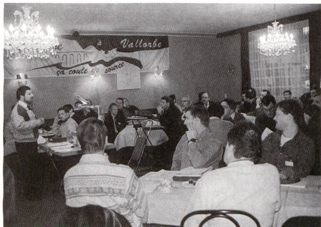
Séminaire sur le bois: notre pétrole indigène.