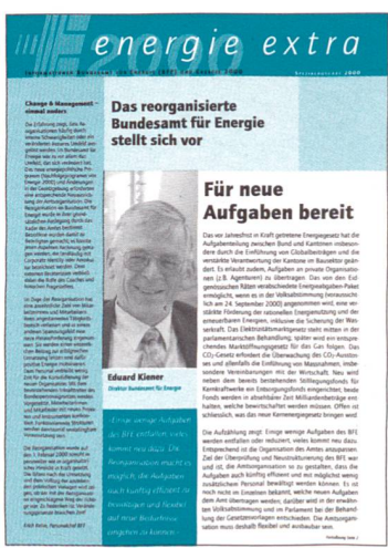
Die Spezialausgabe über die seit dem 1. Februar 2000 geltende Reorganisation des Bundesamtes für Energie ist zu beziehen bei: BFE, Sektion Information, 3003 Bern