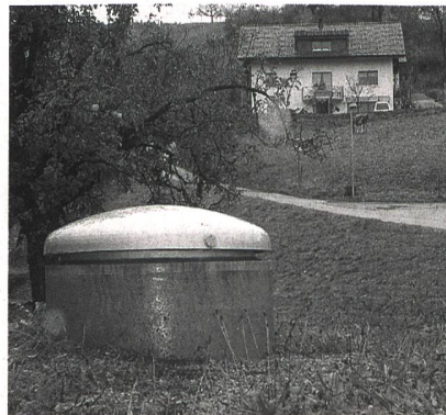
Münsingen, Cité de l'énergie, a réalisé des économies substantielles grâce à un paquet de mesures dans l'approvisionnement en eau potable.

Exemple à Münsingen. Ces trois études de cas ont fait l'objet d'une brochure et, fin juin, d'une conférence à Berne. Près de 60 participants ont alors visité le service d'approvisionnement en eau de Münsingen (Cité de l'énergie). Les fuites y ont diminué de deux tiers ces dernières années, tandis que des pompes à bon rendement et une installation hydroélectrique alimentée à l'eau potable ont été mises en service.